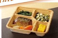
カロリー・塩分調整食