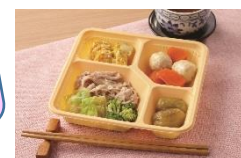
消化にやさしい食