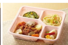
たんぱく・塩分調整食